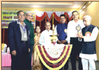
Inauguration by Lighting the Lamp