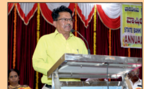
Honouring Medical Insurance Representatives