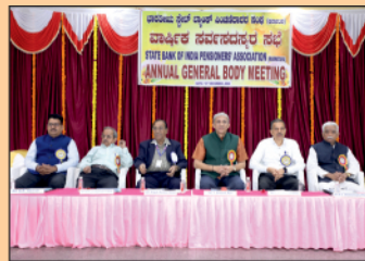
Dignitaries on the Dais